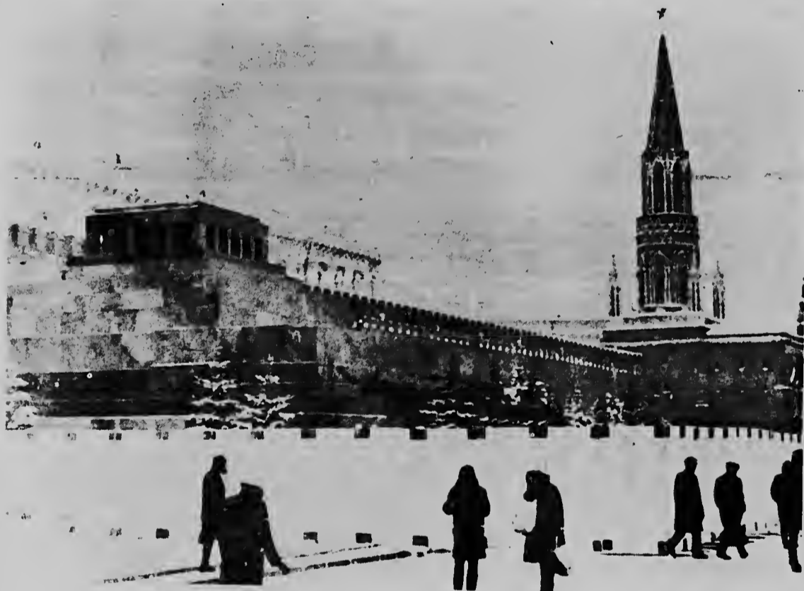
Mientras qu e estudiantenan chinos tabata continuando nan manifestacionnan dilanti di Embahada Sovietica na Moscu, autoridadnan a pone un waya rond di tumba di Lening riba Plaza Roja. Nan a anuncia qu e lugar lo keda serra pa dos luna pa reparacionnan. Fotografonan Chines a saca portret di e waya pa usanan como material di propaganda despues.

ticipa den reunionnan critica contra "Burguesia pensante" cu ta oponer contra e gran revolucion cultural proletaria organiza pa Mao.